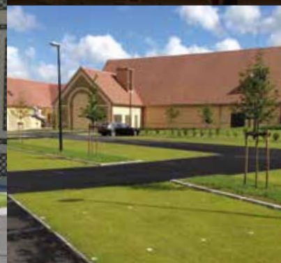
Entrée du Dianetum