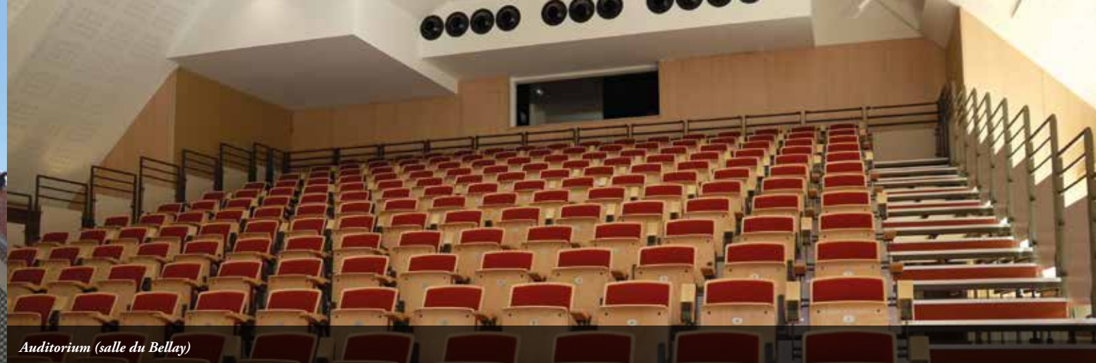
Auditorium (salle du Bellay)

À Anet, vous serez accueillis royalement !